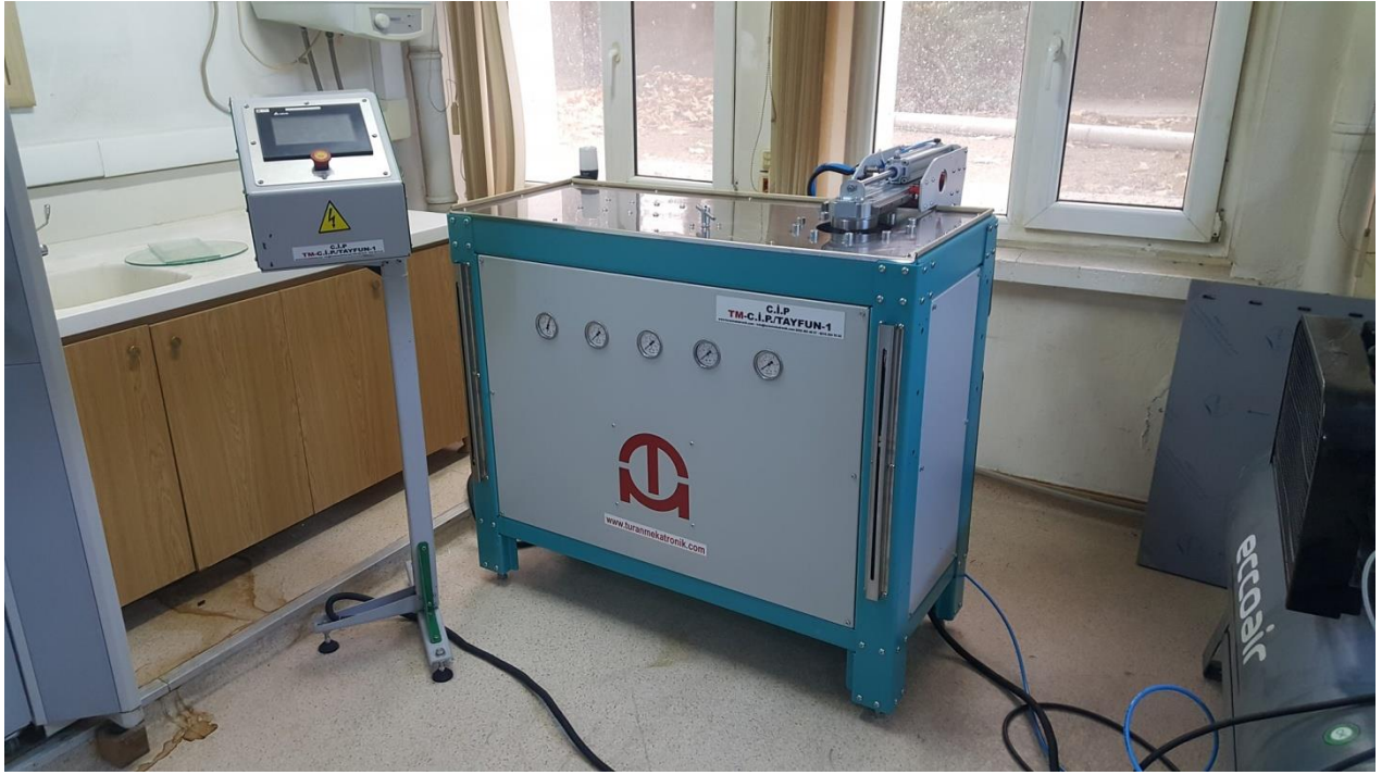
Cihazın net görünümü

Cihaz teknik şartnameye uygun olarak üretilip, montajı yapılacak, teknik hizmet verilecek, iki yıl garantili olacak ve idari şartnameler dikkate alınarak gerekli işler eksiksiz olarak yapılacaktır. Üretici olarak firmamız bu konularda uzmanlığa sahip firmadır.